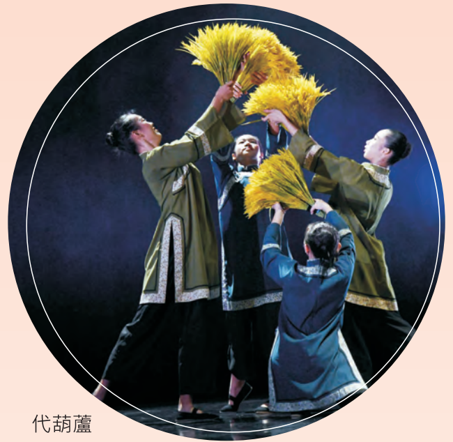
代葫蘆 墩的古名，並 沿用至今。

在張達京的教導下，巴則海族各社已充分了解水源對農業和提高糧食生產力的重要性，於是割讓大片耕地來交換不成比例的灌溉用水，而巴則海族生性自由沒有集體耕種的意識，