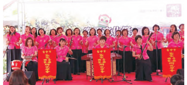
臺中市政府客家事務委員會廣告 / 客家委員會補助

江主委也指出，首屆臺中購物節活動，吸引觀光人潮湧入客家庄，接下來臺中將迎接2020台灣燈會，持續活絡地方經濟，打造臺中幸福城市。